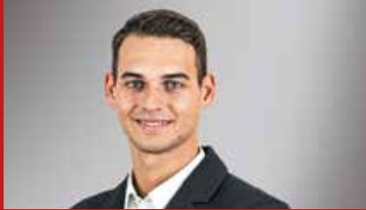
Simon Schuster setzt bei Aktien auf zwei globale Dividendenfonds